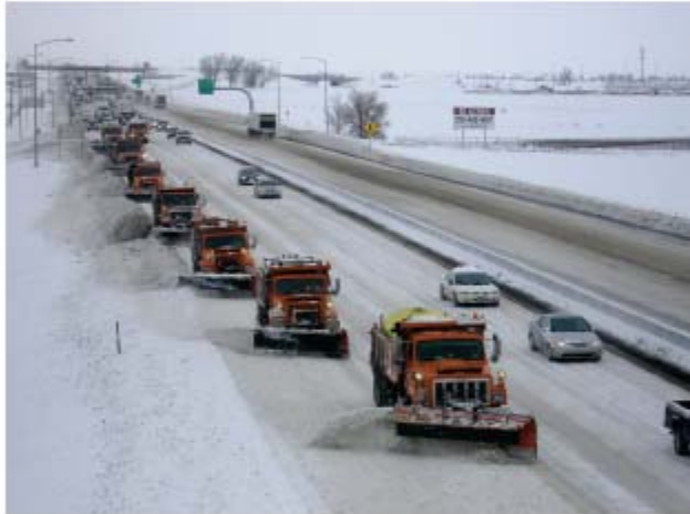
Limpieza de la I-25 durante la tormenta de nieve del 2007