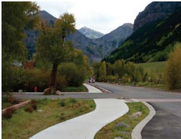
Senderos pavimentados en Telluride