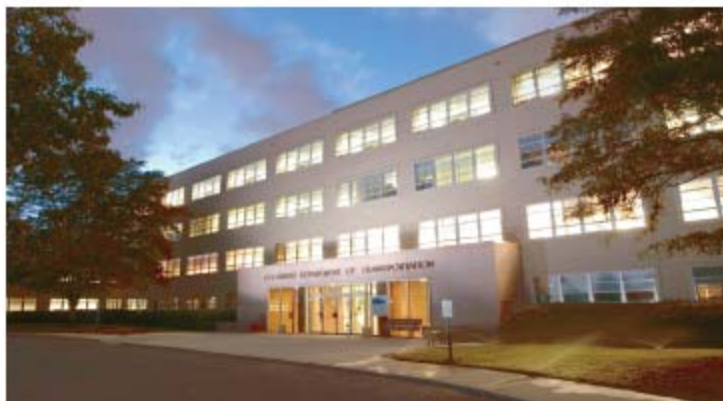
Edificio de las oficinas centrales de CDOT en Denver