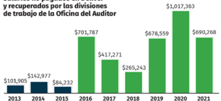
Salarios no pagados en Denver y recuperados por las divisiones de trabajo de la Oficina del Auditor

➔ TOMA DE ACCIÓN: Podríamos tener un cheque para usted esperándole en nuestra oficina si usted o alguien que usted conozca ha recibido una paga por debajo de lo que establece la ley. Revise nuestra página web “¿Le deben dinero? para comprobar si usted o el nombre de algún amigo o familiar suyo aparecen en la lista. Y si usted piensa que le pagan mal y nosotros todavía no hemos iniciado una investigación, envíenos una queja a través del formulario en línea en inglés o español o mándenos un correo electrónico a wagecomplaints@denvergov.org .