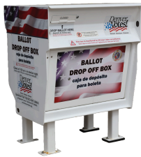
Buzones Electorales (Disponibles las 24 horas)