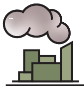
Nguồn gây ô nhiễm không khí